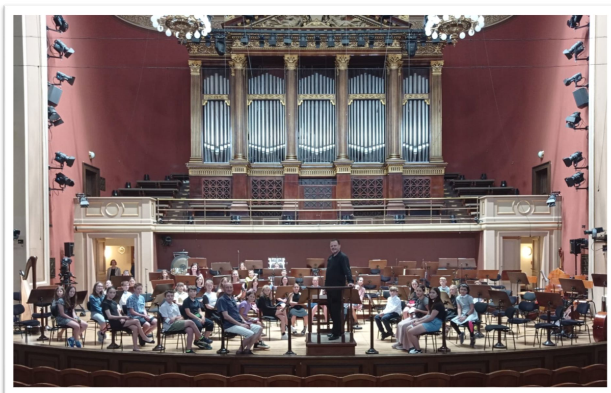
Praha - Rudolfinum – žáci na pódiu

Výlet na společný koncert členů České filharmonie a žáků ZUŠ byl určený pro žáky 4.-5. ročníku hudební nauky. Akce byla spojená s komentovanou prohlídkou Rudolfinu, komentovanou prohlídkou Národního divadla, návštěvou kostela sv. Cyrila a Metoděje a Vyšehradu. Akce byla financována ze Šablon.