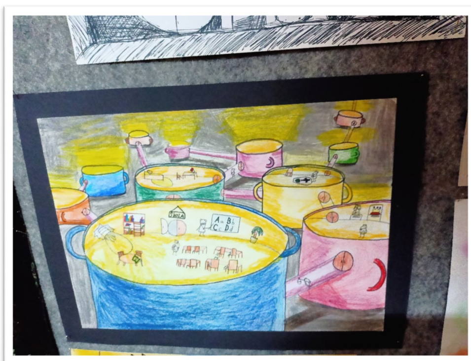
VO – Pod pokličkou