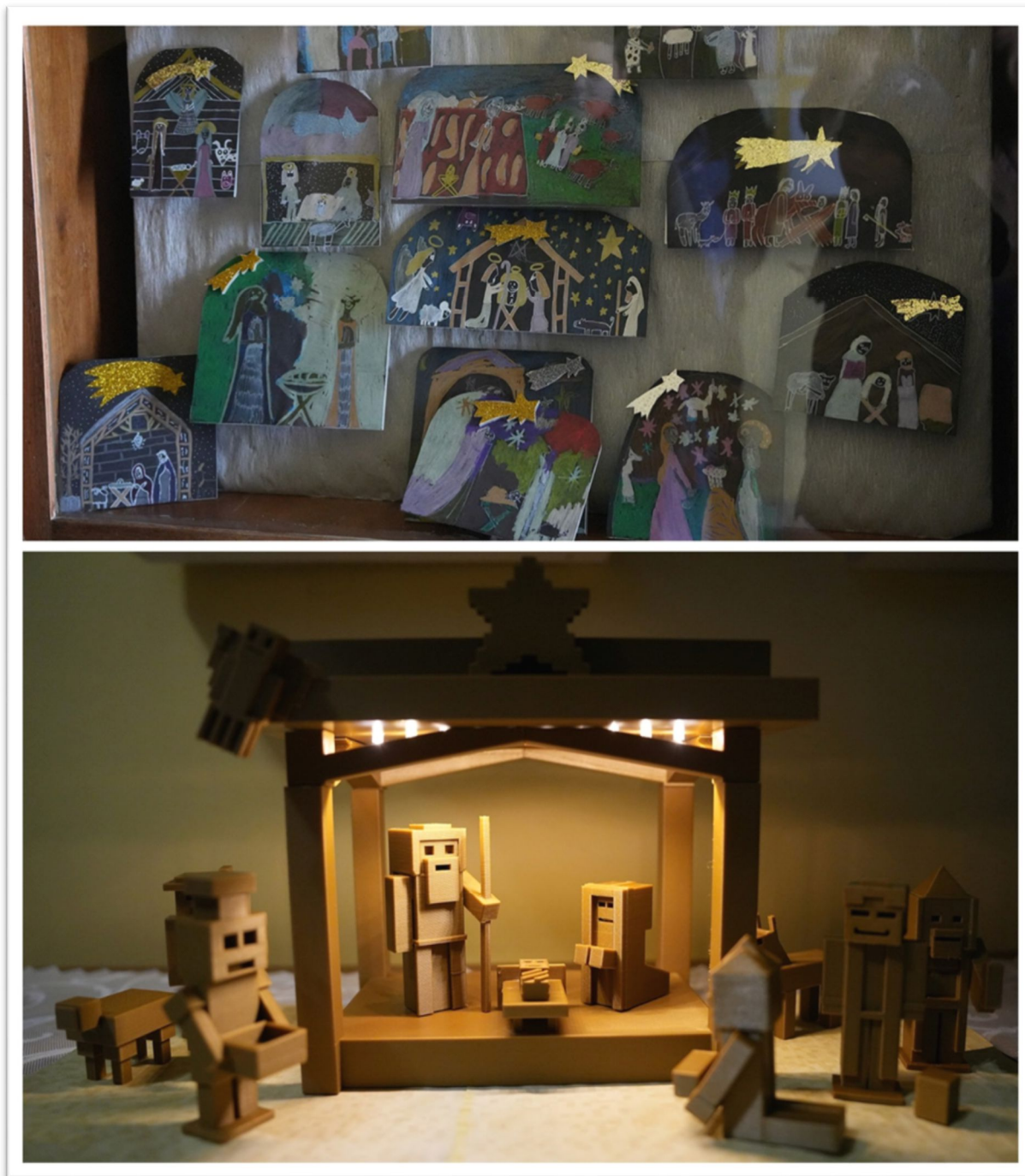
VO – Výstava Betlémů, 3D Betlém - Menecraft

Žáci prezentovali netradiční pojetí Betléma, který byl zpracován ve stylu Minecraft a byl vytištěn na 3D tiskárně. Současně také vystavovali jednotlivé kreslené betlémy ve vitrině kostela.